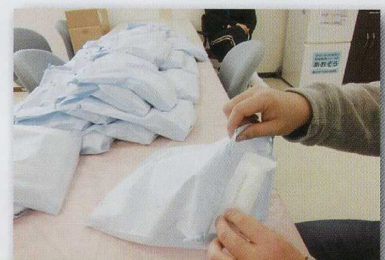
アメニティの袋詰め作業