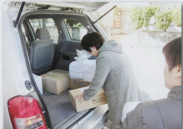
支援員と一緒に配達に行くこともあります