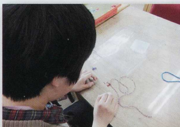
ビーズアクセサリ作成