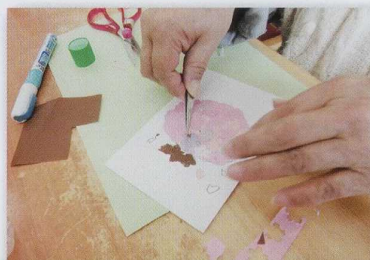
貼り絵ハガキ作成