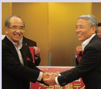
九州地方知事会会長 広瀬大分県知事(左)と九州経済連合会 麻生会長(右)