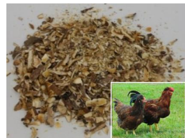
乾シイタケ粉・おおいた冠地どり