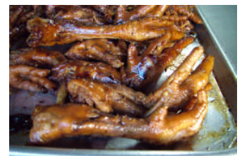
テレビでも紹介されたもみじ