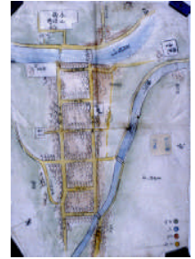
寛政年間の絵図です