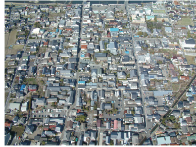
南側より望む航空写真です

街なみ環境整備事業地区内には月隈山、永山布政所(日田陣屋)跡といった歴史的資産もあり、伝統的建造物群保存地区と一体となったまちづくりを進めています。