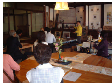
うきは市へ視察に行きました

伝統的建造物群保存事業推進のため、豆田町伝建保存会によるまちづくり事業を推進しており、街なみ環境整備事業の推進に当たっても、相談窓口等の協力体制がとられています。また、月隈山、永山布政所(日田陣屋)跡などの歴史的資産の活用を検討する新たな協議会活動の準備も進めています。さらに、NPO法人本物の伝統を守る会は古建築の調査研究及び技術の継承といった技術面からまちづくりを支援しています。