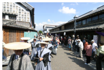
西国筋郡代着任着任行列の 勇壮な時代絵巻

テレビ番組でも紹介された「もみじ」は、日田市内では古くから食べられていた、鶏の足を甘辛く煮た料理です。見た目はグロテスクですが、その味は病み付きになります。