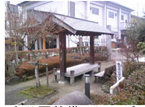
小公園整備(イメージ)