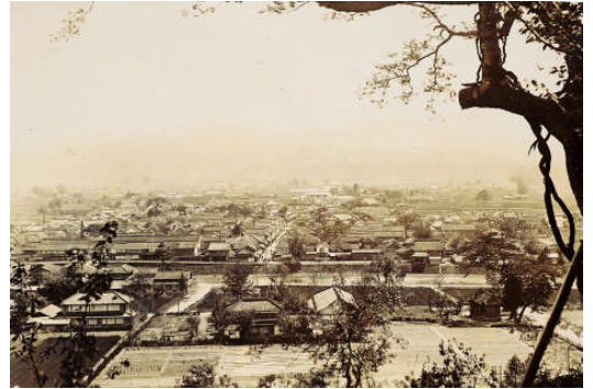
北に位置する月隈山から豆田を望む(明治末期)

明和4年(1767)に日田代官が西国筋郡代に昇格すると、日田は幕府による九州支配の拠点としてますます重要になりました。この頃から、近隣諸国や京都・大阪商人との取引で富を得た商人達が台頭し、代官所の公金を預かり、西国諸大名に貸付ける掛屋(かけや)として活躍する者も現れました。この強力な貸付資本は「日田金(ひたがね)」として知られ、日田は一層経済的発展を遂げました。こうした豊かな経済力を背景に都市文化も花開きました。