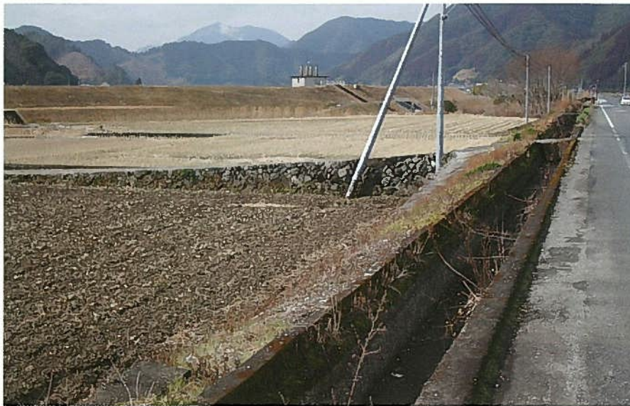
山梨子地区の鬼ヶ瀬井路

鬼ヶ瀬井路の最初の大改修は昭和12～16年の水路改修で、さらに昭和42～47年に取水口と水路を改修しています。