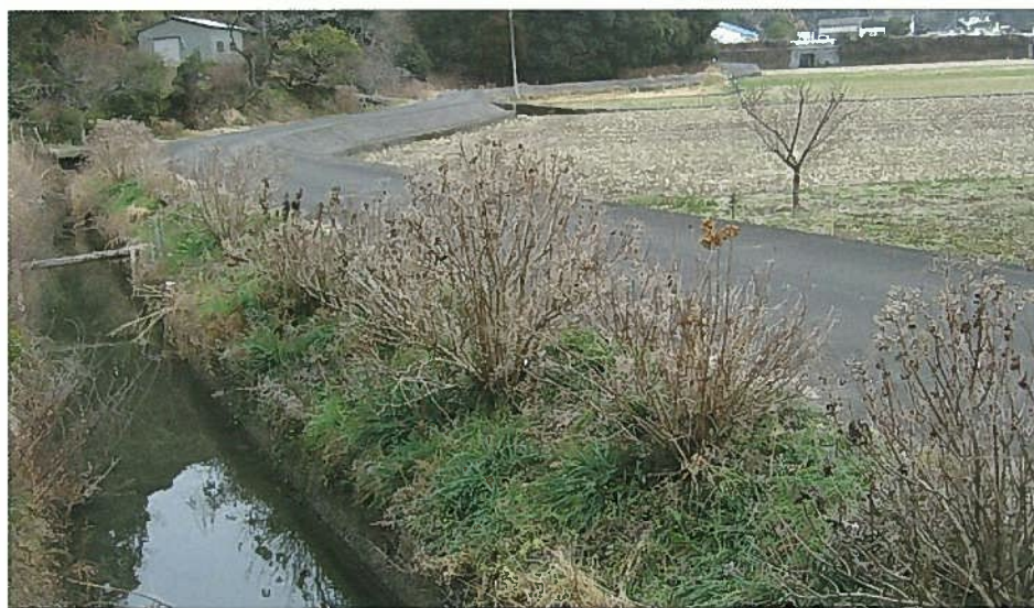
番匠地区を流れる小田井路

この井路の完成により、水田となった農地には、佐伯藩の石高の1割を超える約2,500石の米の生産量があったことから、藩の経営安定に大きく貢献しました。