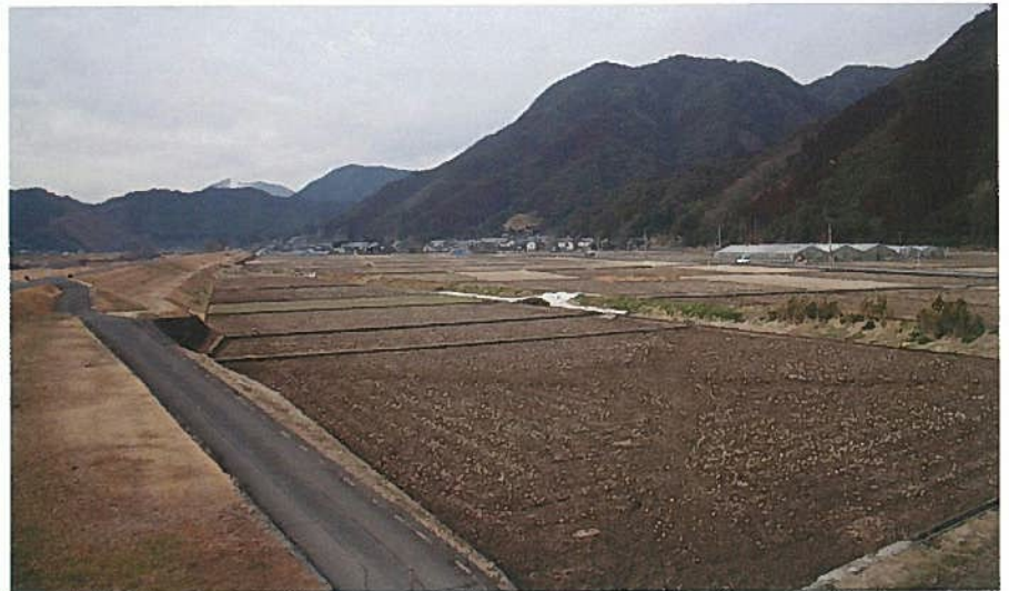
鬼ヶ瀬井路の受益地(山梨子地区)

中でも井崎地区は米がとれない村として幕府に報告されていましたが、井路により、米がとれるようになりました。