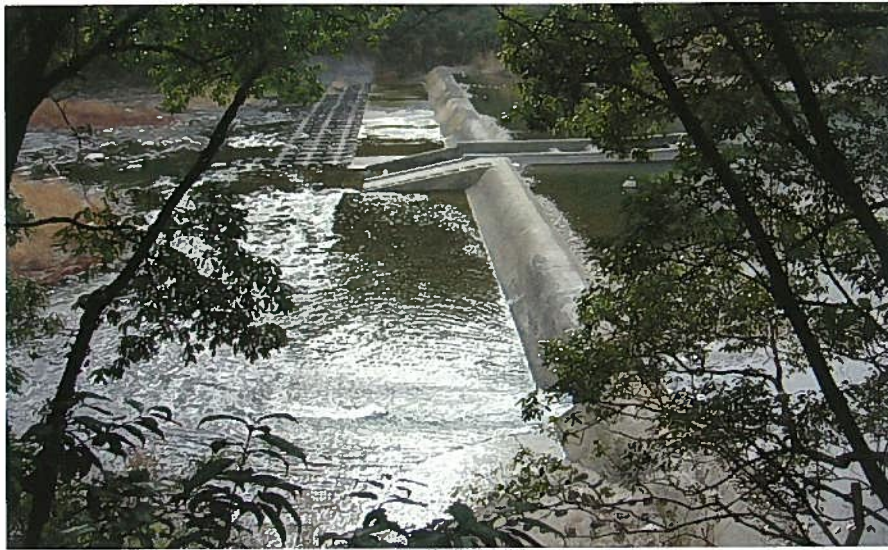
おにがせいせき 鬼ヶ瀬井堰