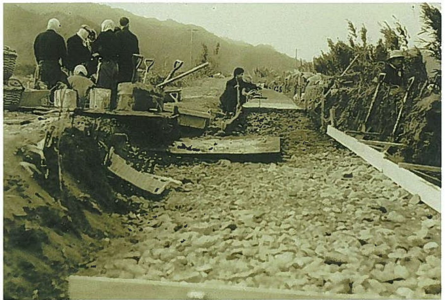
昭和29年の水路改修(コンクリート張り)

度重なる改修を行いましたが、小田井路は建設当時とほとんど変わらない場所にあり、現役の水路として利用されています。