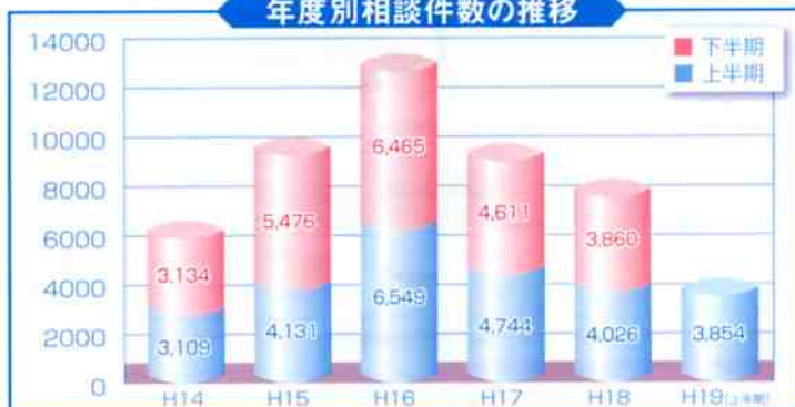
年度別相談件数の推移

これは、サラ金・ヤミ金に関する相談や、ネットを利用したオンライン等関連サービスが依然多いものの、架空請求にかかる相談が減少したことが主な要因となっています。