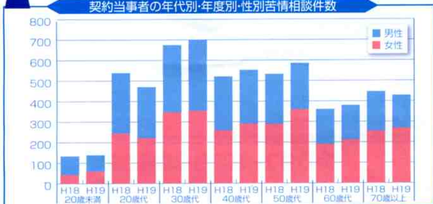
契約当事者の年代別・年度別・性別苦情相談件数

①苦情相談の契約当事者の内訳は女性が52.4%(1,873件)、男性が45.8%(1,636件)、その他(団体等)1.8%(67件)となっています。