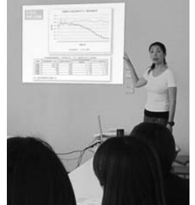
不妊についてのお話