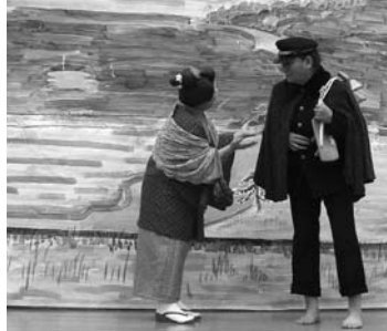
一寸劇 寛一お宮の自立