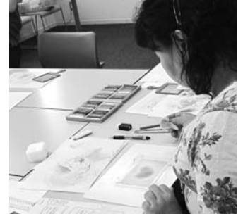
パステルシャインアート