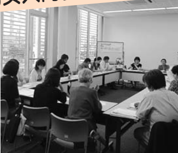
ワーク・ライフ・バランスを考える