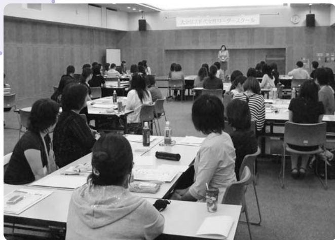
修了に当たってのアイネス所長挨拶