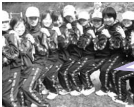
▶「せーの!」で全員座れたよ! 中学生の新生生活泊研修での一場面