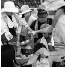
◀「人間知恵の輪」解けるかな? ABC体験プログラムでの一場面