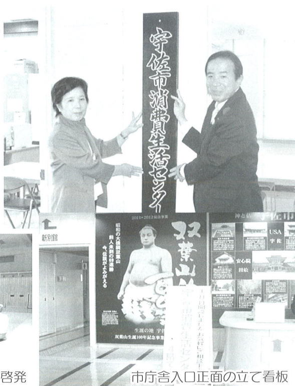
市庁舎入口正面の立て看板