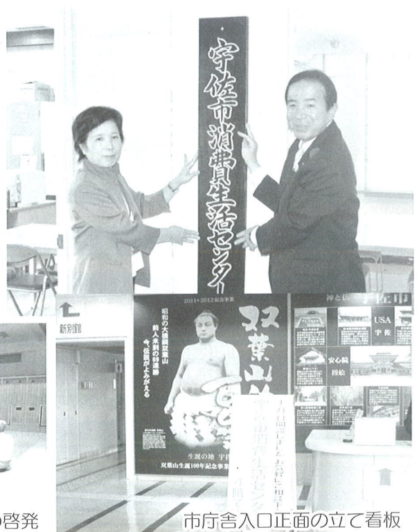
市庁舎入口正面の立て看板