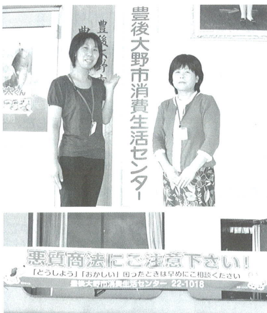
▲ 市の庁舎に掲示されている横断幕

今月の「消費生活のひろば」では、豊後大野市と宇佐市から寄せられた写真とコメントを掲載します。