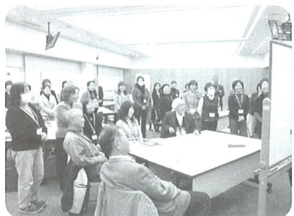
地域くらしのサポーターと消費者行政担当者等によるワークショップ(12/19,20)

63名のサポーターさんそれぞれが、日常生活の中で、行政の消費生活相談業務や、啓発事業にご協力いただけることを心から願っています。