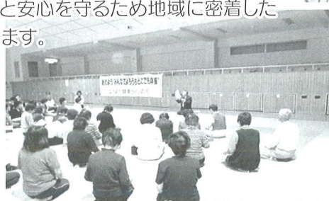
介護予防教室での啓発