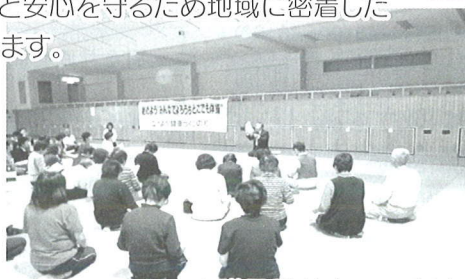
介護予防教室での啓発