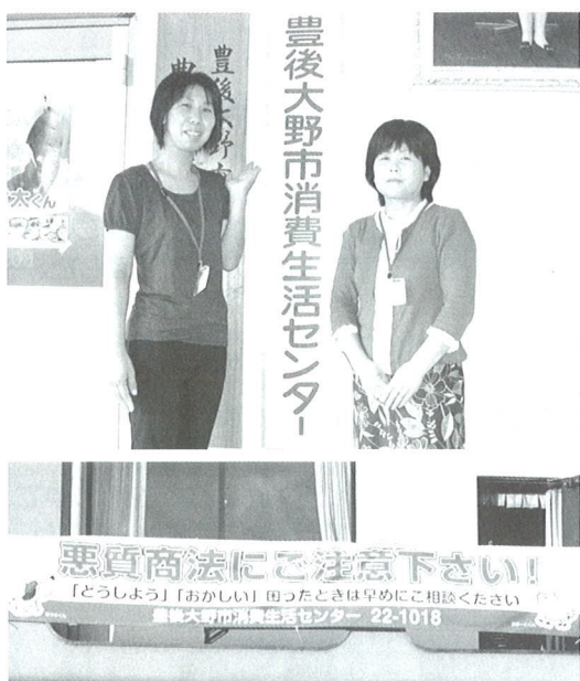
▲ 市の庁舎に掲示されている横断幕

今月の「消費生活のひろば」では、豊後大野市と宇佐市から寄せられた写真とコメントを掲載します。