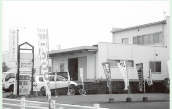
福岡県久留米市にあるダイシンの営業所

県や市町村の消費生活相談窓口には、平成21年度以降、15件の相談が寄せられていました。相談者は、75歳から89歳の高齢者で、契約額は平均368,000円でした。