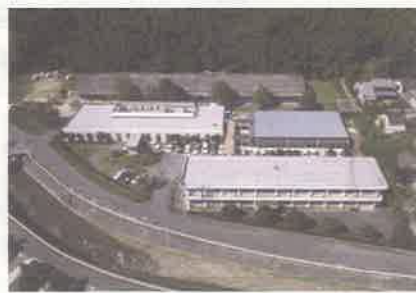
埋蔵文化財センター航空写真

土器や石器の洗浄・接合・図面作成などの作業見学や普段は入れないたくさんの遺物が収められた収蔵庫見学など、埋蔵文化財センターのバックヤードを見学したり、黒曜石の切れ味を試すなどの歴史体験を親子で楽しみませんか?