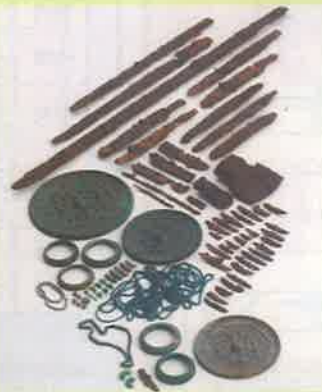
免ヶ平古墳出土品