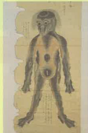
「豊後国肥田川童図」 江戸時代初めに現在の日田市で捕まったカッパの姿を描いたもの。