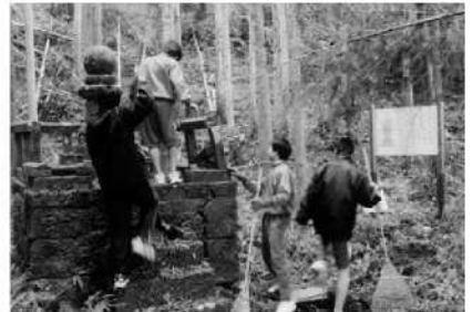
中学生による文化財の清掃活動(杵築市)

見学者のアクセスを考慮した案内板の整備と統一したデザインの説明板作製を関係部局と連携して行います。