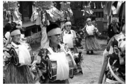
辻間楽愛護少年団(日出町)

指導者の育成及び発表機会の拡充等を通して、地域に伝わる伝統文化の伝承活動を行う子どもたちの活動を支援します。