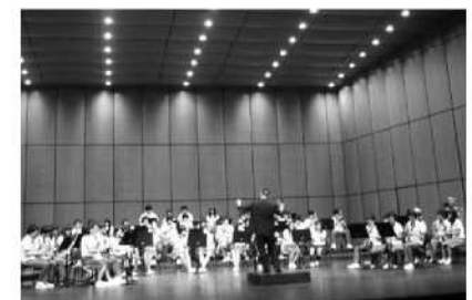
湖西高校、瑞山中央高校との合同演奏