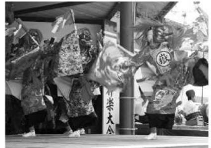
御嶽神楽(豊後大野市)

大分の文化のすばらしさをアピールするため、神楽や祭りなどの民俗文化財を、映像を交えて紹介します。