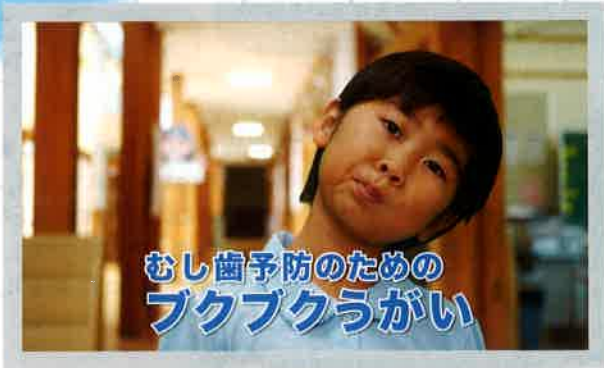
むし歯予防のための ブクブクうがい