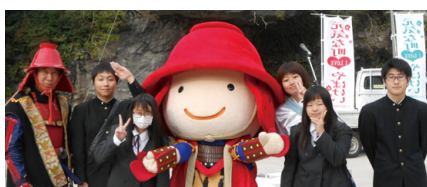
地域を活性化 地域イベントにスタッフとして参加