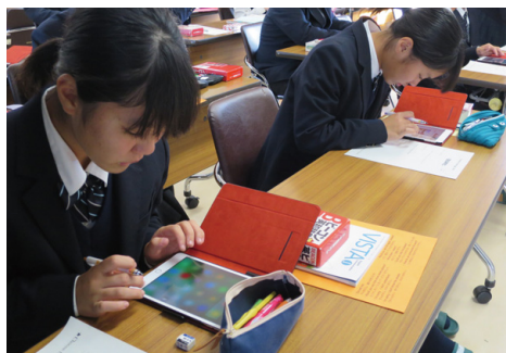
力を伸ばす1人1台タブレット学習