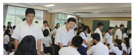
マナースキルアップセミナー 外部講師招聘授業