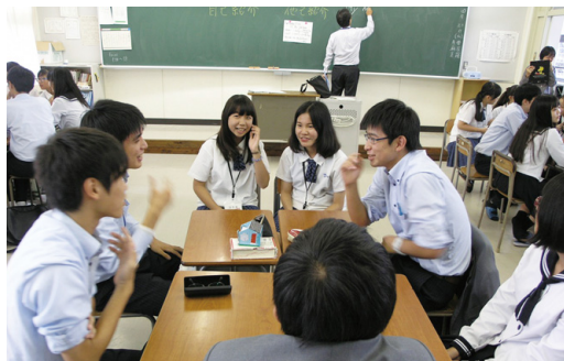
台湾 小港高級中学校との交流会