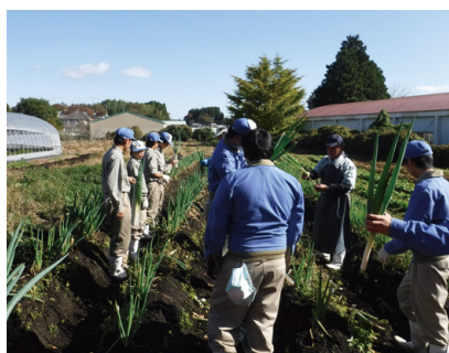
安心いちばんおおいた産農産物認証(白ネギ)