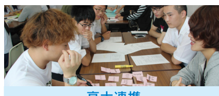
高大連携 別府大学国際経営学部講義 「観光戦略論」を大学生と一緒に受講