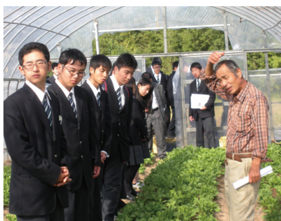
有機栽培農家現地視察