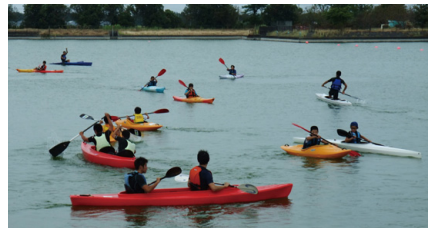
高カヌーフェスティバル 小中学生カヌー体験教室