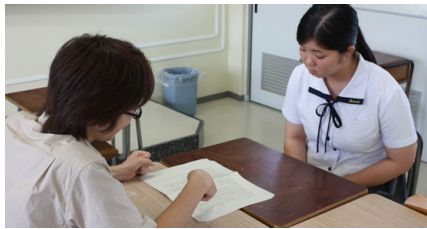
現役京大生OB・OGチューター 先輩からの進路アドバイス、学習指導