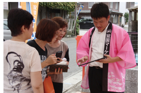
地域を盛り上げる双国マーケット