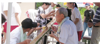
地域での体験実習 高齢者サロンの方とのそうめん流し