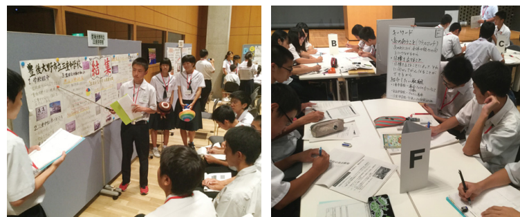
「学び向かう学校」づくり中核校生徒連絡協議会の様子

詳しい内容については県教育委員会ホームページをご覧ください。 平成28年度 全国学力調査結果 大分県教委 検索