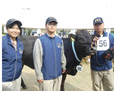
大分県畜産共進会に参加