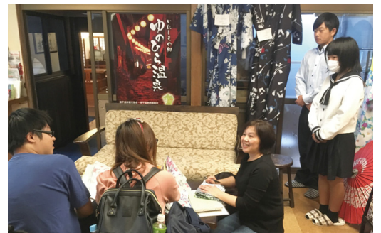
海外観光客へのおもてなしインターンシップ