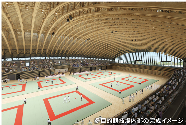
多目的競技場内部の完成イメージ (実施設計時)

問 屋内スポーツ施設建設推進室 TEL 097-506-5649 屋内スポーツ施設 大分県 検索