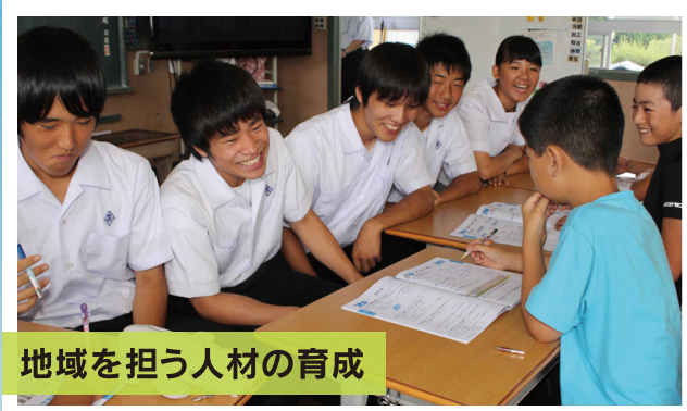
地域を担う人材の育成

地域の高校では、「生徒が行きたい学校、生徒に選ばれる学校」を目指して、地域と連携した魅力・特色ある学校づくりを進めています。学校の中だけでなく、積極的に地域に出向き、地域の方々と協力して楽しく学び、自分の成長にもつながる魅力的な取組が行われています。