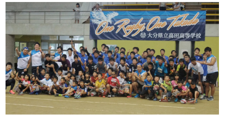
高ラグビーフェスティバル トップリーガーによるラグビー教室