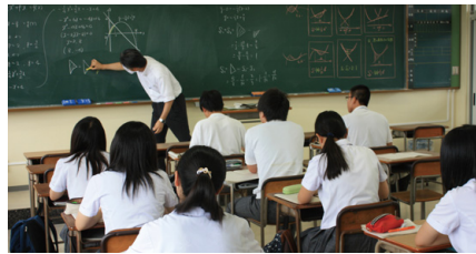
予備校講師による特別講義 集中講義で徹底指導