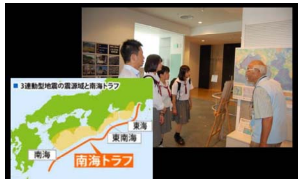
<阪神・淡路大震災記念人と防災未来センター>

被害状況を分析して再現されたCG映像や復興に至るまでの道のりのドラマの上映、子どもたちが楽しく学べる教材やゲームなどの各コーナーを見学した。偶然、ボランティアの語り部の方から、当時の様子などじっくりと聞かせていただいた。