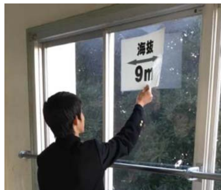
<校内に海拔を表示>