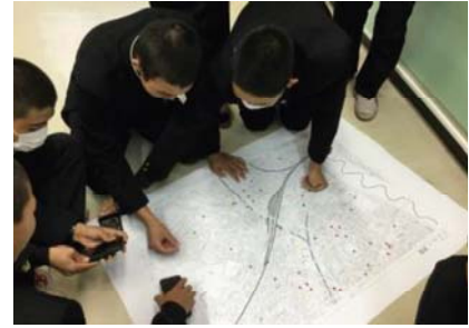
<防災マップの作成>