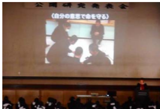
<公開研究発表会の様子>