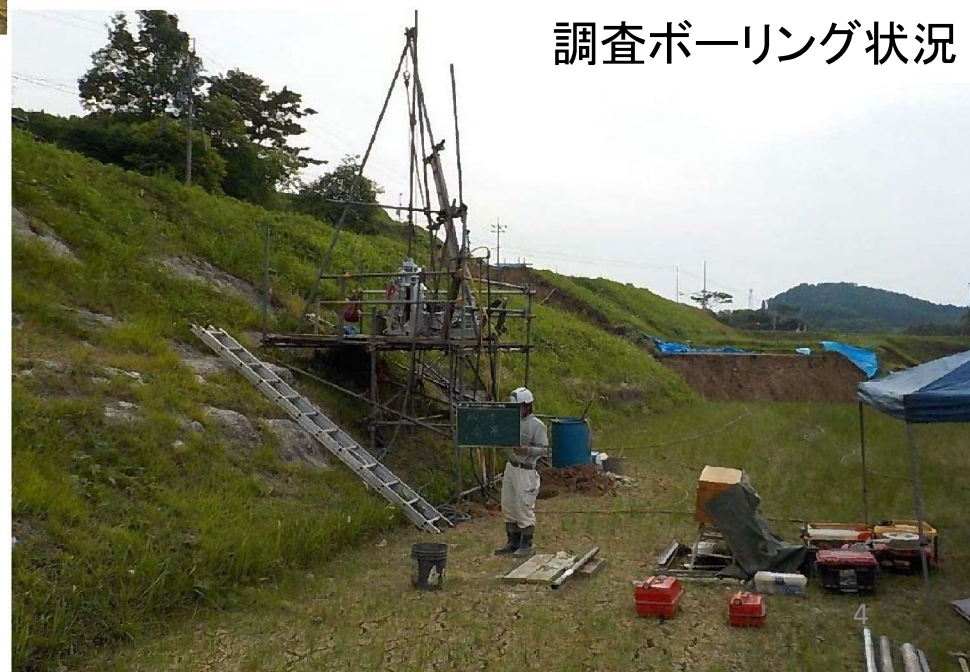
調査ボーリング状況

調査ボーリング... 地すべりの原因や対策に必要な地質や地下水の状況について調査する縦方向のボーリングです。