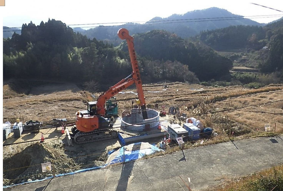
集水井工状況(直径3.5m)

地すべりの原因の一つである地下水を直径3.5mの井戸を掘削し、横方向のボーリングにより集水して、地すべり地外へ排水します。これにより地すべりを抑制します。