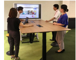
ViCreAの打合せスペース コミュニケーションの活性化が期待されます

理の問題は、毎朝のグループミーティングとスマホ を活用したグループメールでの情報共有で対応しま した。また、席の固定化という問題は、PCを使っ たくじ引きにより配席することで解消しました。