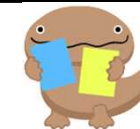
宇佐市教委イメージキャラクター サンちゃん

「元気」…身体的・精神的に健康であり、子どもや学校や地域のために協力して行動できる人