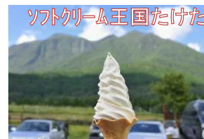
ソフトクリーム王国たけた