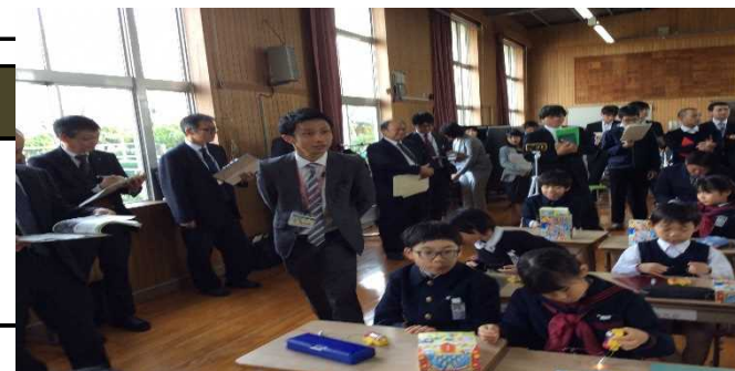
県教育委員会指導主事・大学教授とともに授業研究