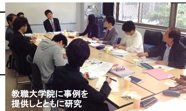
教職大学院に事例を提供しとともに研究