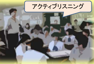
アクティブリスニング