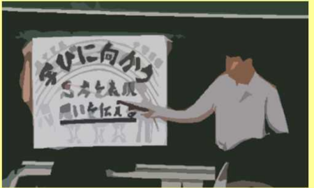
先生方へ授業のお願い