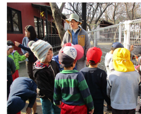
大根大きくなっているかな！