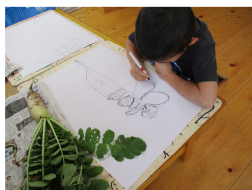
葉っぱの形は・・・