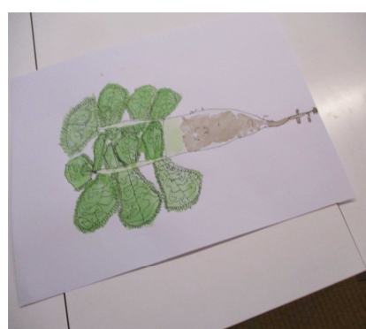
水彩で色をつけたよ！