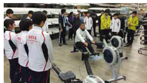
ジュニア選手発掘の取組