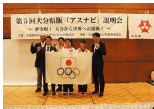
県内企業への就職支援により世界を目指す本県出身選手