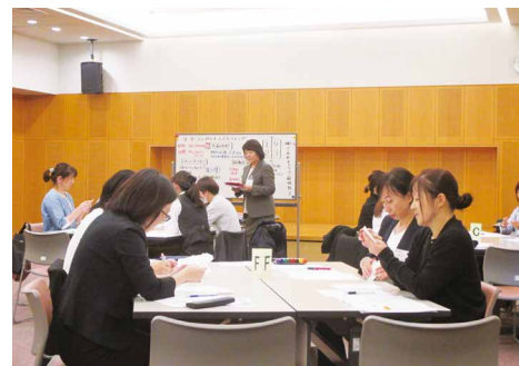
次世代女性リーダー養成セミナー