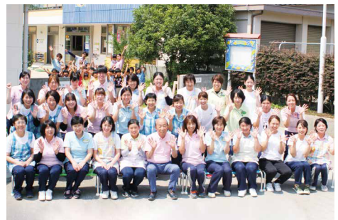
事業所ぐるみで取り組む 「健康経営事業所」