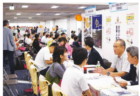
東京で開催した移住相談会