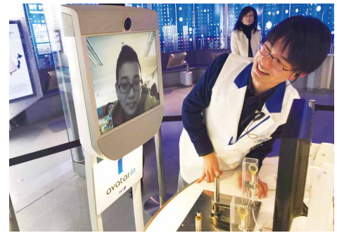
遠隔操作ロボット「アバター」を活用した社会見学