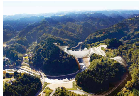
玉来ダム完成予想図