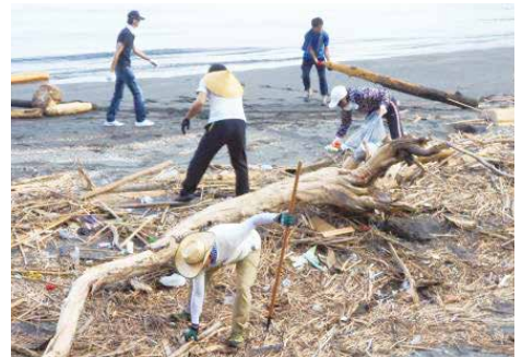
小規模集落応援隊による海岸清掃