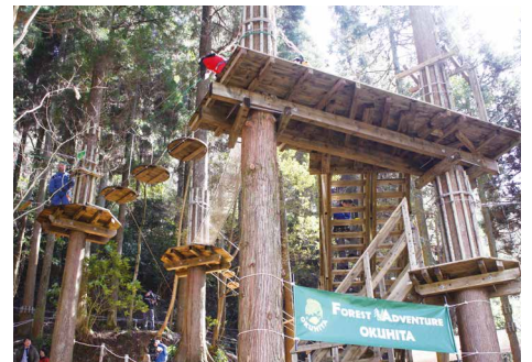
奥日田の自然を活用したアクティビティ