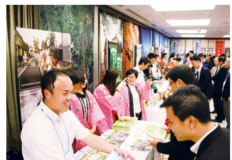
大分県海外プロモーション