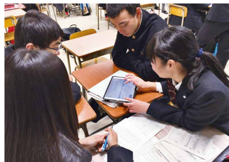
タブレット型端末を活用した授業