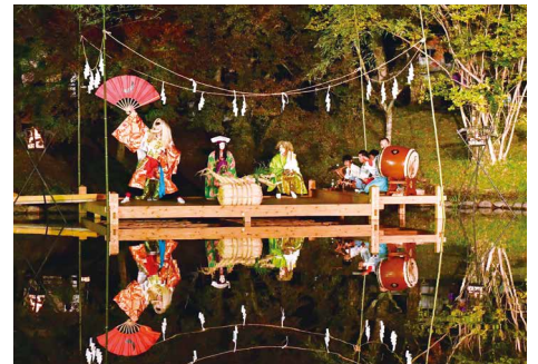
用作公園で舞う夜神楽「水鏡」