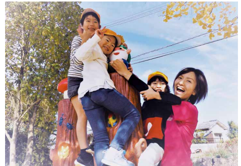
認定こども園の園児たち