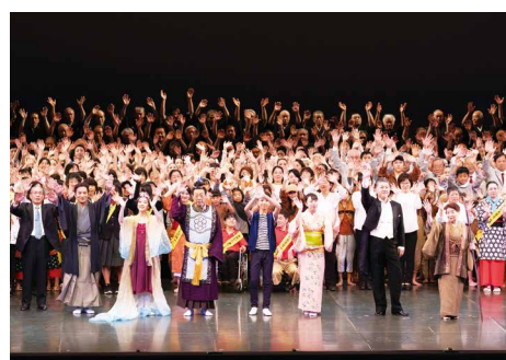
第33回国民文化祭・おおいた2018、 第18回全国障害者芸術・文化祭おおいた大会