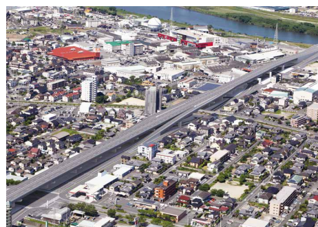
庄の原佐野線（下郡工区）の完成予想図