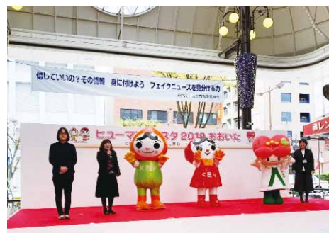
人権啓発フェスティバル