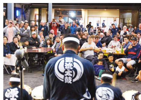
ラグビーワールドカップに合わせた地域の魅力発信 (源流太鼓)