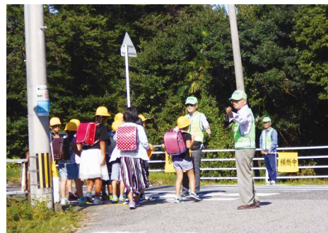
自主防犯パトロール隊との協働による 児童の見守り活動