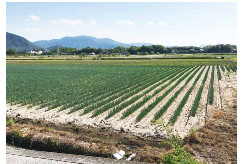
水田の畑地化による大規模園芸産地づくり