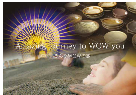
海外向け大分県 PR 動画