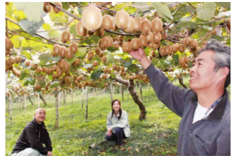
生産拡大を目指すキウイフルーツ