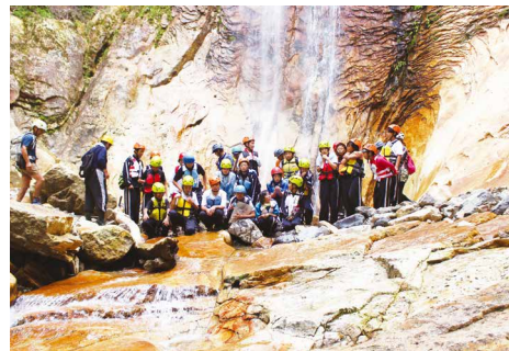
祖母・傾・大崩ユネスコエコパーク 自然体験