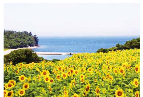
滞在型観光の拠点となる長崎鼻