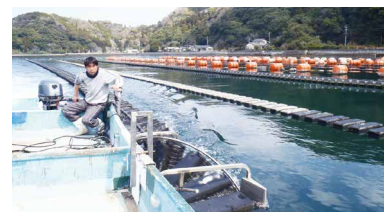
赤潮防除効果も期待される一粒カキ (シングルシードオイスター) の養殖