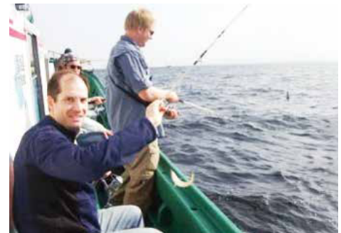
外国人観光客向けガイド付き釣り体験