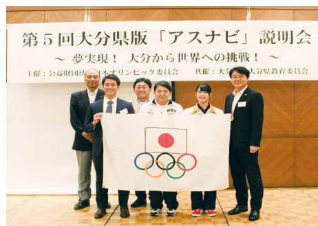
県内企業への就職支援により 世界を目指す本県アスリート