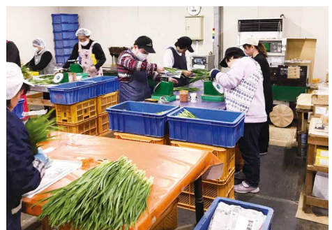
選果場で働く障がい者