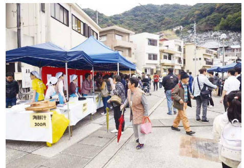
保戸島の食の祭典 [VICOLO 保戸島つまみ食い路地]