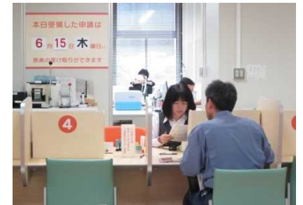
[大分市パスポートセンター]

これにより、パスポート事務の県内全市町村への移譲が完了するとともに、県内に住民登録がある方及び県外に住民登録をしている方で県内に居住している方は、県内どの市町村でも申請ができるようになり、利便性の向上が図られました。