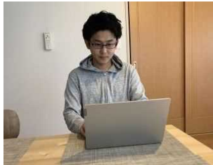
[ワールドカップ期間中の在宅勤務の様子]

また、職員の在宅勤務にもタブレット端末を活用し、ラグビーワールドカップ2019開催時には、延べ213人の職員が在宅勤務を実施しました。