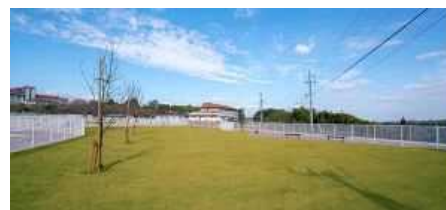
[みどりのドッグラン]