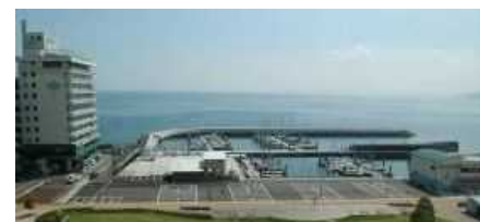
[富城ヨットハーバー]