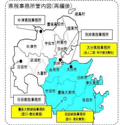
[県税事務所管内図]

併せて、県民の利便性の確保や市町村との連携、迅速な滞納処分等に対応できるよう、佐伯・豊後大野各地域に「納税事務所」を新設しています。