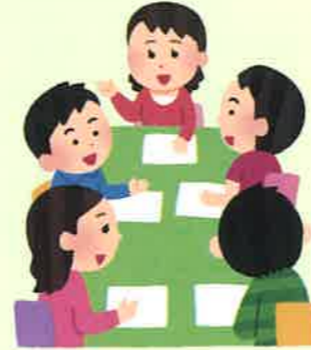
ベクトルを合わせて協働と切磋琢磨