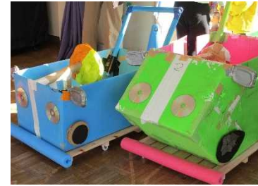
左は、水色1号車。 右は、緑色2号車。