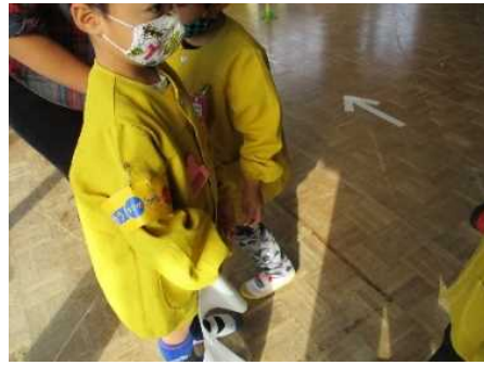
「1号車、レディー、ゴー！」