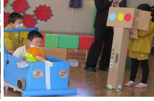
信号を見て止まる1号車。 信号機役は、懐中電灯を光らせる。