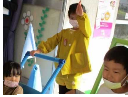
「1号車準備 OK」の合図を送る。