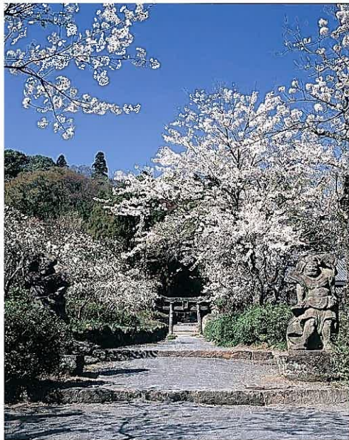
—国東半島の神社仏閣—