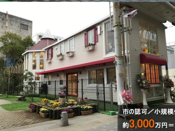
市の認可／小規模保育施設／19名定員