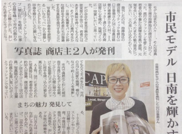
店主らが写真集を発刊