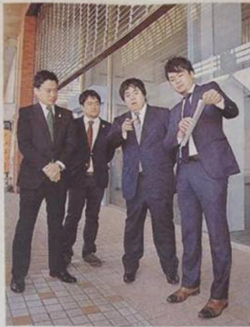
事務所となる空き店舗前で、改修後のイメージを崎田恭平市長(左)らに説明する春日博文社長(右から2人目) 日南市の油津商店街

めさす。22日に市と同社の調印式があり、崎田恭平市長は「雇用が生まれ、人の出入りが増えるため、商店街の消費拡大につながる」と期待感を示した。