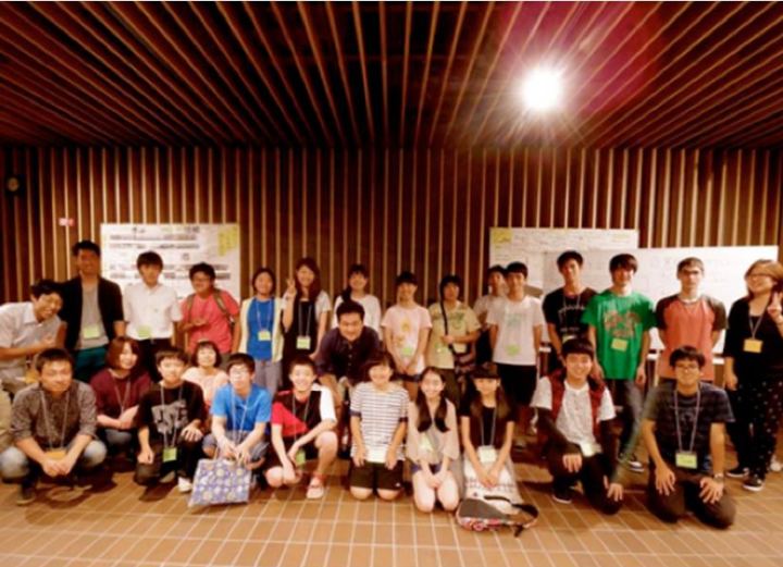
中高生が土曜夜市を復活