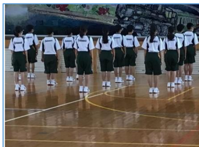
NO.138 2021年6月 大分市立坂ノ市中学校

今後は、学校経営計画表にあるそれぞれの「取組項目」は、生徒にどのような「資質・能力（3本柱）」を育成しているのかを明確にすることで、校長先生がおっしゃった「人と関わる力」「人（相手）のことを考える力」「自分を知る力」の育成につながり、「学校経営の重点（目標項目）」や、目指す生徒像に近づいていくことでしょう。