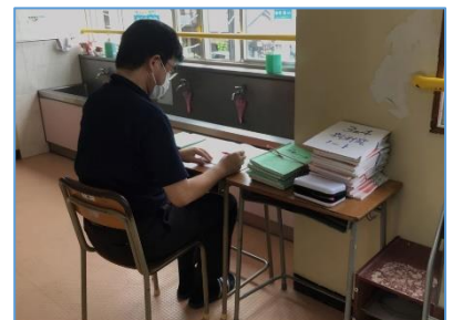
NO.139 2021年6月 大分市立坂ノ市中学校