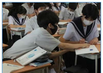
NO.140 2021年6月 大分市立坂ノ市中学校