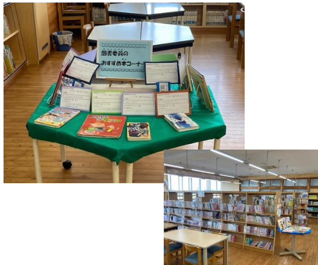
図書館環境の充実