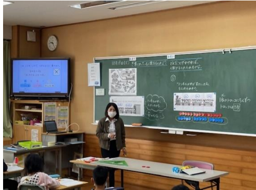
2年 算数科⇒デジタル教科書