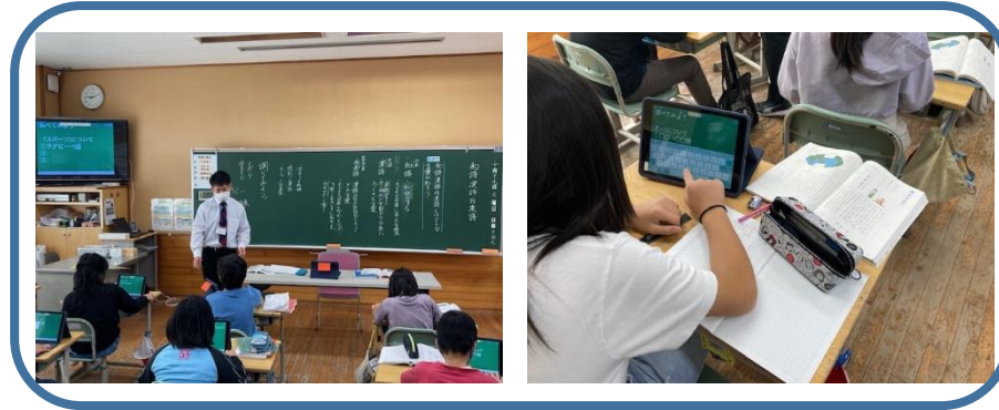
5年 国語科⇒タブレット活用