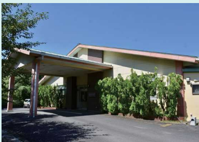
昨日の自分より何か出来るようになるろう