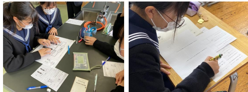
3年 理科、1年 国語科の教具、ワークシート