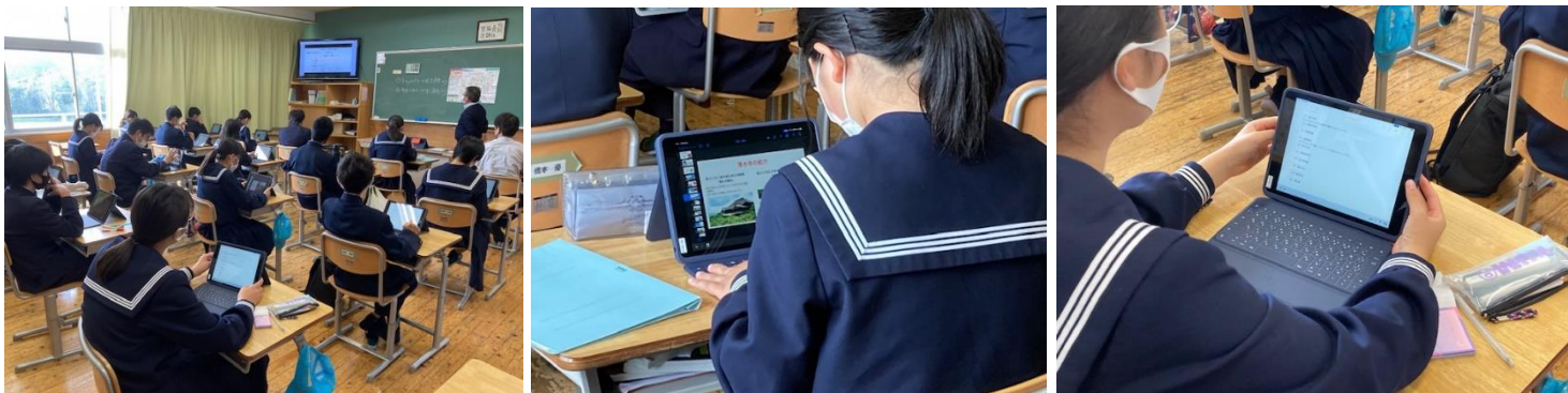
2年 技術科⇒1人1台端末の活用