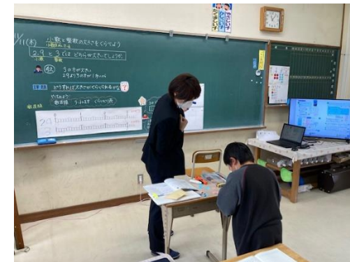
ICT機器の効果的活用 整えられた板書