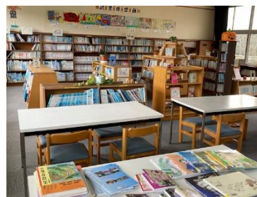
図書館環境、読書活動の充実