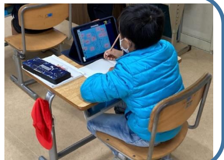
2年 国語科⇒1人1台端末の活用