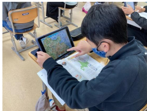
6年 算数科 ⇒1人1台端末の活用