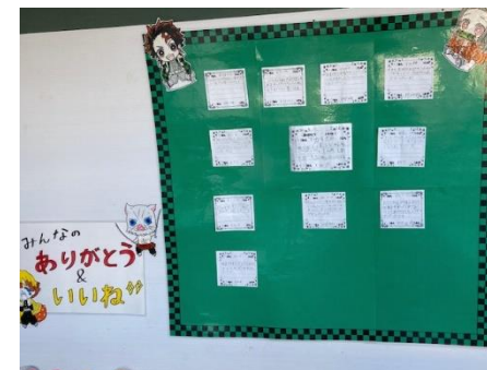
ありがとう&いいね カード