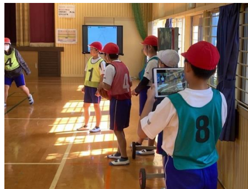
5・6年 体育科 ⇒バスケットボール試合撮影