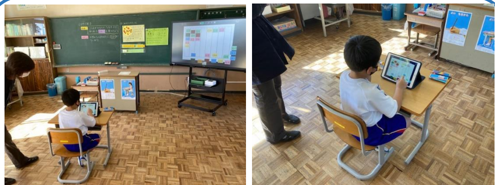
1年 算数科⇒1人1台端末の活用