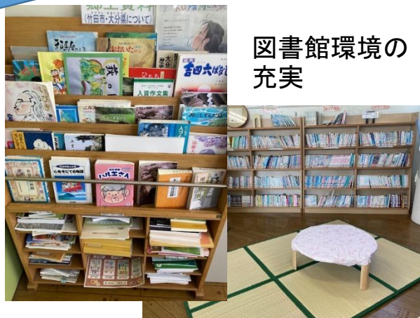
図書館環境の 充実

1. 4年の国語科では、文と文をつなぐ言葉(接続詞)についての学習において、例文を作成して児童に適切な接続詞の使い方についてタブレット端末の活用が見られました。1年の道徳科では、NHK for schoolの活用が見られました。映像を見ながら児童は自分自身と向き合う姿が見られました。2年の算数科では、デジタル教科書を活用して、九九表からきまりを見つける学習を行っていました。