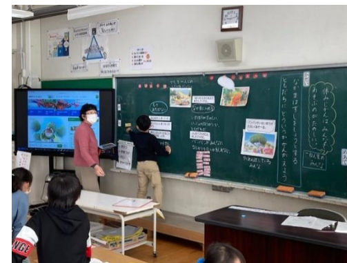
1年 道徳科 ⇒NHK for school活用