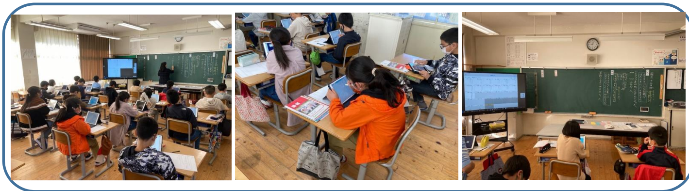
4年 国語科 ⇒1人1台端末の活用