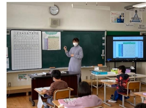
2年 算数科 ⇒デジタル教科書