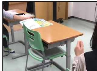
NO.553 2021年11月 大分市立敷戸小・植田東中 はばたき分校