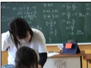
NO.556 2021年11月 大分市立敷戸小・植田東中 はばたき分校