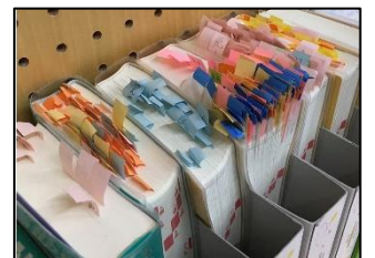
NO.555 2021年11月 大分市立敷戸小・植田東中 はばたき分校

困っている友達に、そっと教科書を見せる。思いだけでなく行動することが真の優しさ。