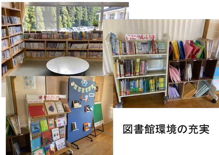
図書館環境の充実