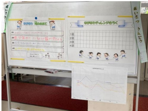
ながなわチャレンジ 班のめあて設定 ⇒ 記録を記入