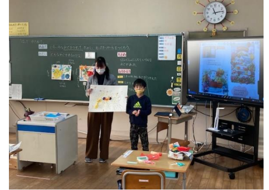
2年 生活科 ⇒ 1人1台端末の活用