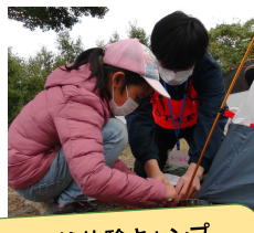
これぞ、定番！生き活き自然体験キャンプ