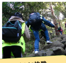
国東半島峯道ロングトレイルに挑戦