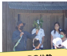
大分の名産カボスに触れる！農業体験