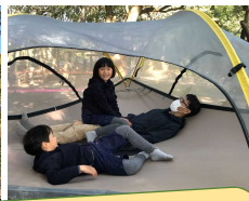
森の魅力満載！体験活動ミーティング「森フェス」