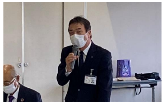
丁寧に児童生徒に向き合い、誰一人取り残さない学校へ (寺岡市教育長)