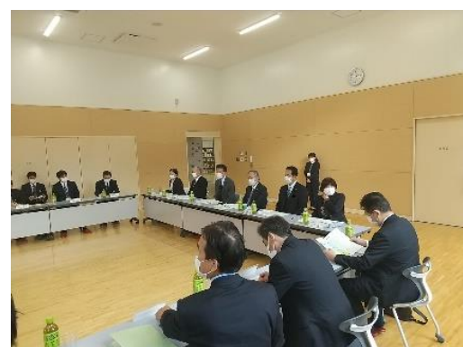
関わり合いながら学ぶ生徒の姿や地域コミュニティとしての役割の視点から協議

「生徒と共に創る授業」において、生徒自身が学習目標を設定する取組がなされている。この学習目標をどう使っていかを明確にすることと、目標のゴールとしての具体をどのレベルに置くのかを考えていくことが大切である。