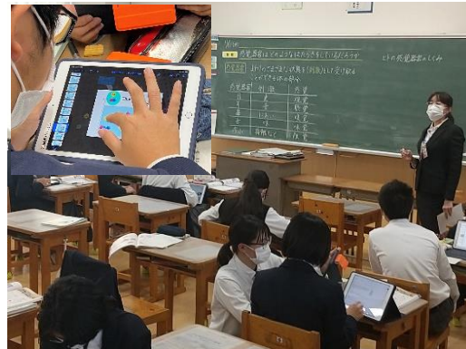
タブレット端末を学びのツールとして活用

当日の授業参観では、全学級でタブレット端末を活用する授業の公開がなされました。調べ学習や資料提示だけでなく、振り返り問題で学習内容の定着を図るために AI ドリルによる個別学習をしていたり、モデル図を操作して説明に活用していたりと様々な工夫がなされていました。交流活動においては、親和的な関係性のもと、学びを深めている生徒の様子が見られました。