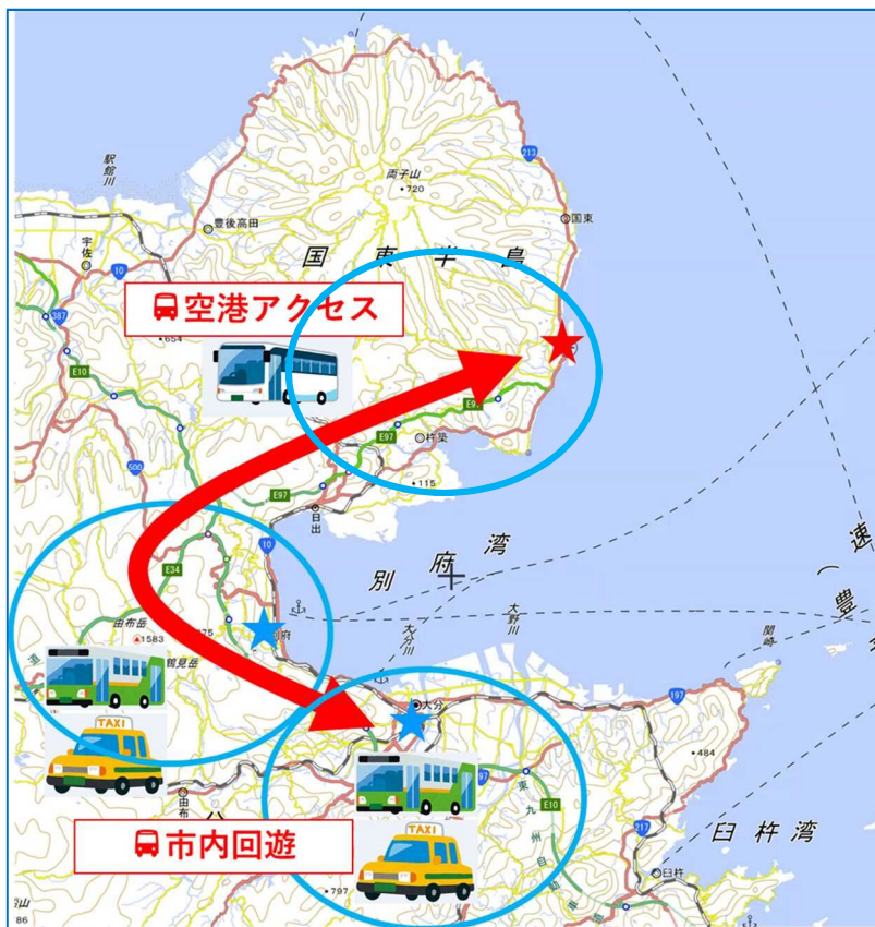
大分空港を起点としたMaaS実証実験のイメージ