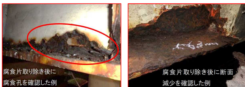
腐食片を取り除いた状態の例(主桁)