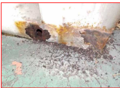
腐食片を取り除いた状態の例（地覆部）