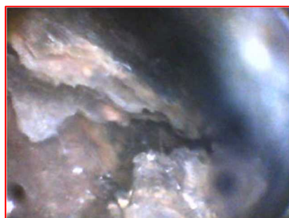
地覆内部で滞水を確認：主桁側腐食状況