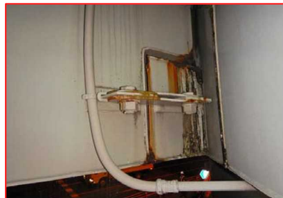
ゲルバー部支承周辺の状態 (主桁・支承部)