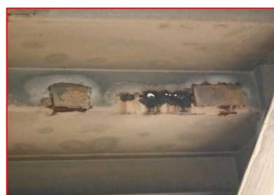
腐食片を取り除いた状態の例(階段部)