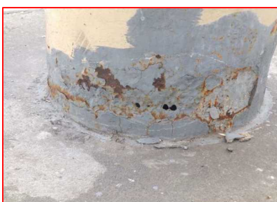
腐食片を取り除いた状態例(下部)