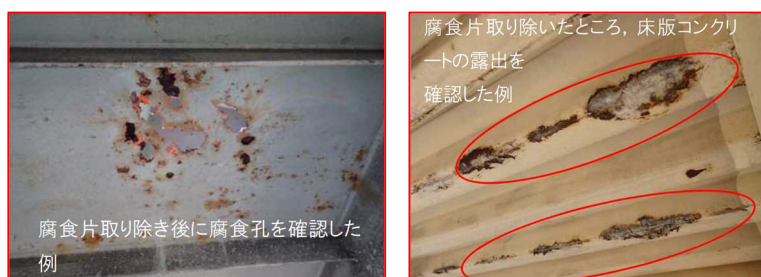
腐食片を取り除いた状態の例 (床版)