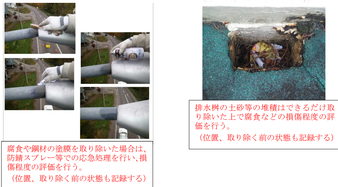
図-8. 2. 1 点検時に応急処置を行った状況例

なお、損傷程度の評価と記録にあたっては、腐食や鋼材・塗膜・コンクリートのうき・剥離は、土砂等の堆積や植生等をできるだけ取り除いた上で行う。これらの位置や取り除く前の状態も記録しておくこと。