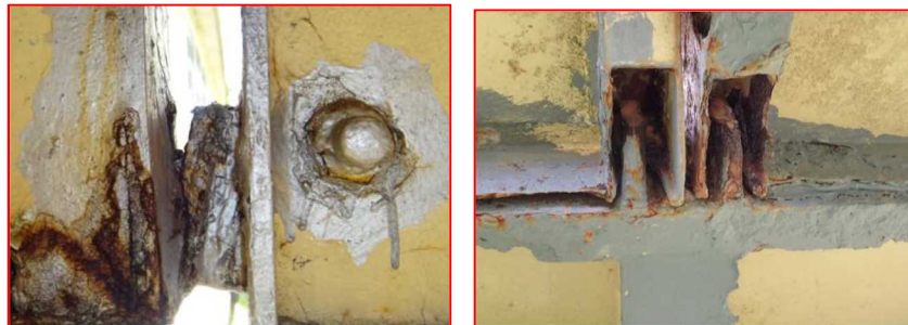
フックの溶接の状態 (接合部)