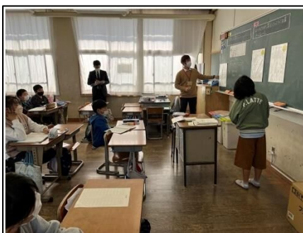
NO.395 2022年11月 大分市立丹生小学校