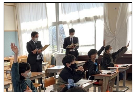
NO.393 2022年11月 大分市立丹生小学校