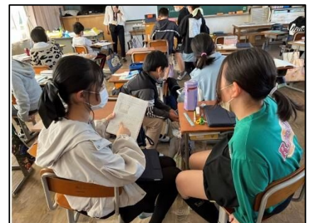
NO.396 2022年11月 大分市立丹生小学校