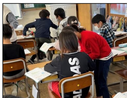
NO.394 2022年11月 大分市立丹生小学校

自信をもって説明できるのは、友達と学び合ったから。そして、聴いてくれる友達がいるから。