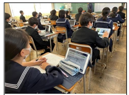
NO.403 2022年11月 大分市立植田西中学校