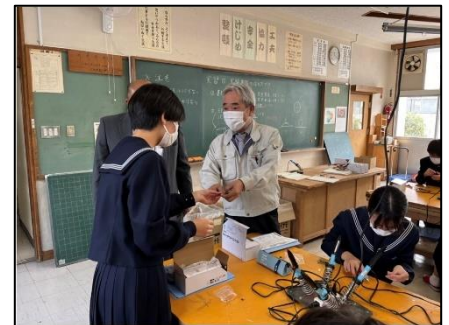
NO.406 2022年11月 大分市立植田西中学校