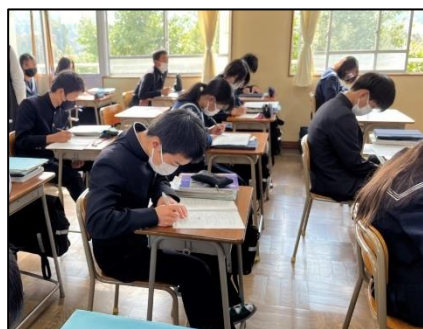
NO.404 2022年11月 大分市立植田西中学校

慣れないことだから、人に頼ることができないから、集中して行う。だから、完成した時に達成感がある。