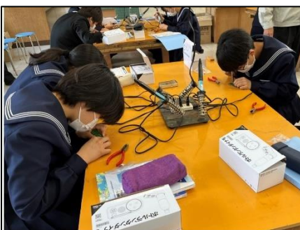
NO.405 2022年11月 大分市立植田西中学校

疑問に思ったことやわからない時は、調べるか人に聞くしかない。だから、自分から行動する。