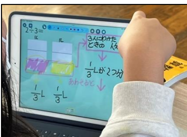
NO.435 2022年11月 大分市立佐賀関小学校

最初から最後まで集中して取り組む。途中で投げ出ししたりはしない。だから、学力だけでなく、集中力や忍耐力もつく。