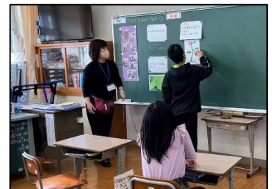
NO.433 2022年11月 大分市立佐賀関小学校