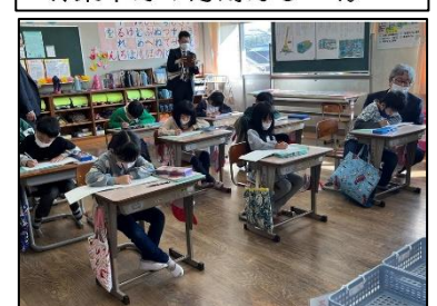
NO.429 2022年11月 大分市立佐賀関小学校

考えてもわからないことは多くある。そのような時は調べるしかない。納得するまで調べるから、自分の力になる。