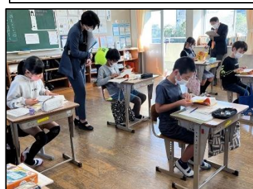
NO.434 2022年11月 大分市立佐賀関小学校

算数の答えは一つだけど、説明の仕方や考え方はみんな異なる。そこに、私らしさがでる。