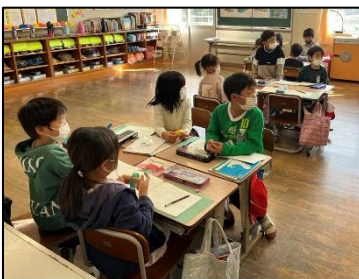
NO.432 2022年11月 大分市立佐賀関小学校