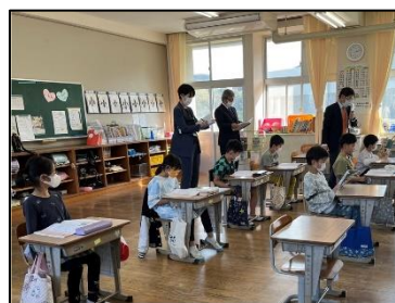
NO.431 2022年11月 大分市立佐賀関小学校

みんなの考えを出し合うと、共通点や相違点がわかる。そして、新たな考えがうまれる。