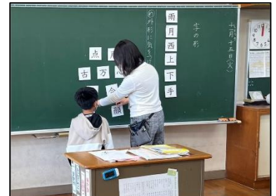
NO.430 2022年11月 大分市立佐賀関小学校