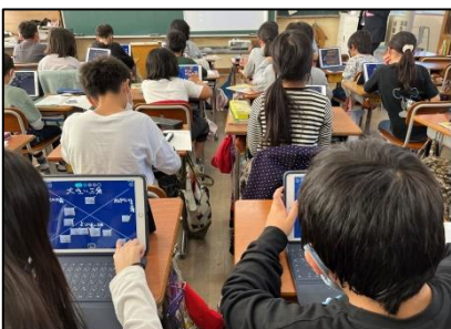
NO.506 2022年11月 大分市立宗方小学校