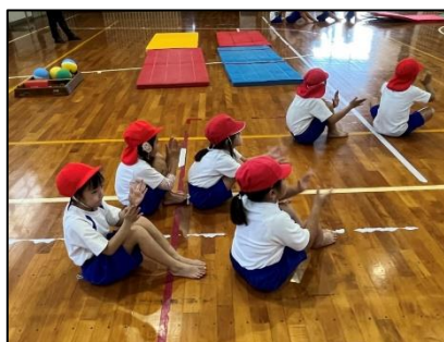
NO.508 2022年11月 大分市立宗方小学校

タブレットは、自由に動かしたり、考えをまとめたり、友達の考えを知るための道具。そんな道具を使って学び合うのは人間。