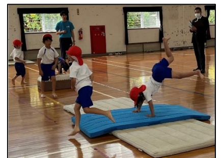
NO.507 2022年11月 大分市立宗方小学校

拍手は、「すごいよ」「がんばれ」「上手だよ」「おめでとう」そんな思いが込められている。