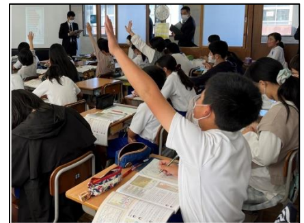
NO.505 2022年11月 大分市立宗方小学校