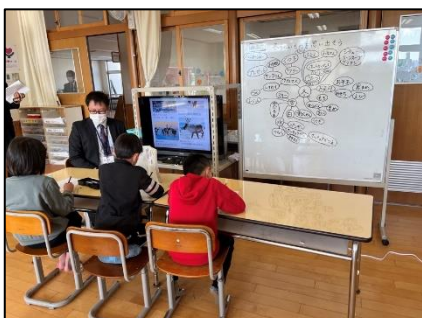
NO.602 2022年12月 大分市立南大分小学校

思い切ってチャレンジできるのは、見守ってくれる先生がいるから。励ましてくれる友達がいるから。