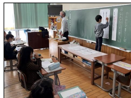
NO.601 2022年12月 大分市立南大分小学校

それぞれの考えの良さを認め合い支え合うと、優しさにあふれた環境が生まれる。だから、安心して学ぶことができる。