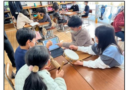
NO.600 2022年12月 大分市立南大分小学校

「がんばって」「私と同じだよ」そのような思いを背中を感じるから、安心して説明できる。