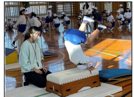
NO.599 2022年12月 大分市立南大分小学校

考えたことを実際にやってみると、上手い出来ないこともある。そこから、新たな課題が見つかり、学びが深くなる。