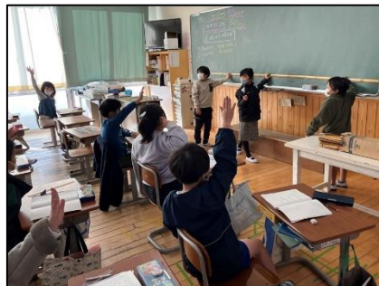
NO.598 2022年12月 大分市立南大分小学校

美点凝視。相手の良さをしっかり見る。そのことを、相手に感謝の気持ちを添えて伝える。