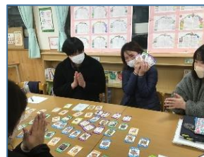
NO.638 2022年12月 大分市立舞鶴小学校