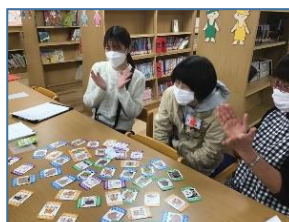
NO.636 2022年12月 大分市立舞鶴小学校