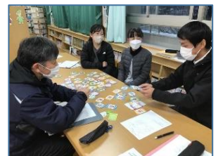
NO.636 2022年12月 大分市立舞鶴小学校