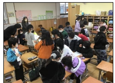
NO.633 2022年12月 大分市立舞鶴小学校