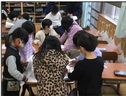
NO.634 2022年12月 大分市立舞鶴小学校

お手紙を書く。チューリップの絵を描く。お金を貯めて花屋で買う。お菓子を買う。花屋さんでいろいろな色のチューリップの花束を買う。チューリップ型のお手紙。チューリップの写真をとってあげる。先生に許可をもらう。チューリップのハンカチやシャーペンや入浴剤や石けんをあげる。歌を歌いながら折り紙でチューリップをつくる。自分で最初から育てる。お母さんに頼んでケーキを買って食べさせる。