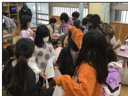
NO.635 2022年12月 大分市立舞鶴小学校