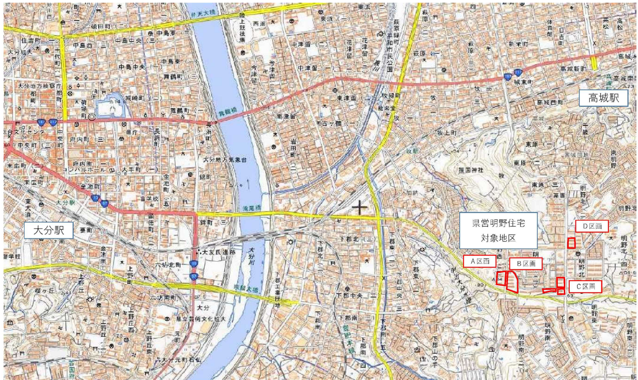
※朱書き部分は大分県追記