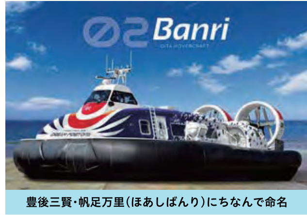
豊後三賢・帆足万里(ほあしばんり)にちなんで命名

実験期間／1月12日(木)～3月31日(金) 参加方法／アプリ「my route」をダウンロード 内容／① 移動に最適な経路の提案 ② 観光情報や見どころの紹介 ③ デジタルチケットの購入