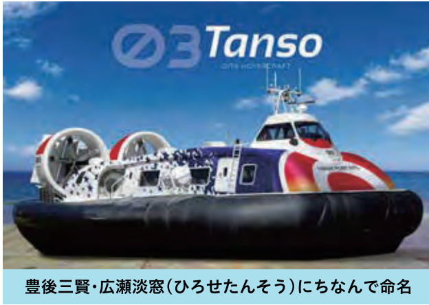
豊後三賢・広瀬淡窓(ひろせたんそう)にちなんで命名

【デザインコンセプト】 フロントは赤と濃紺の2色の基本カラーで「未来につながる非日常的な乗り物を表現。サイドはホーバーが海を走る際に起こる水しぶきの粒を屋根でイメージ